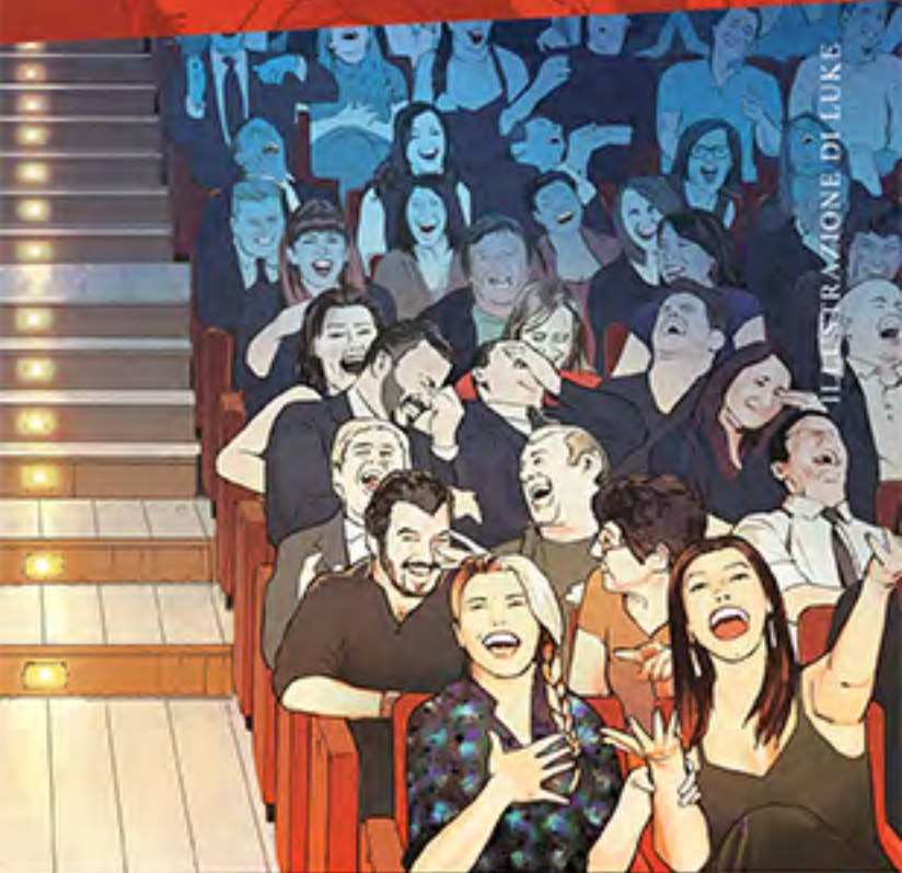
ILLUSTRAZIONE DI LUKE